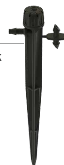
SD-B-STK Magasság: 15,2 cm