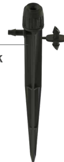
HS-B-STK Magasság: 15,2 cm