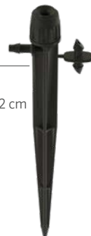
HS-B-STK Hauteur : 15,2 cm