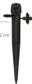
SD-B-STK Hauteur : 15,2 cm