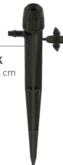
HS-B-STK Altura: 15,2 cm