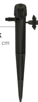
SD-B-STK Altura: 15,2 cm