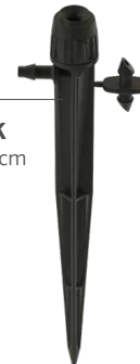
HS-B-STK Höhe: 15,2 cm